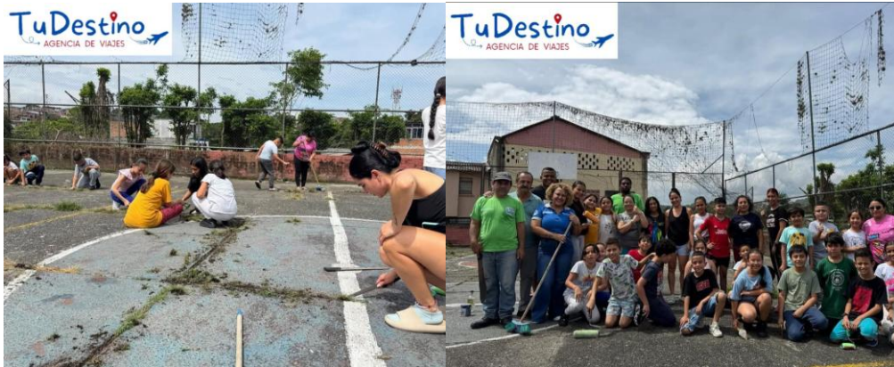
Embellecimiento de parques