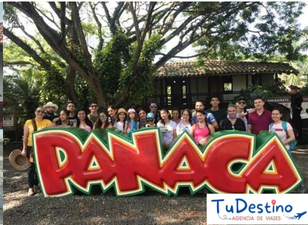
Parque del Café y Panaca (Montenegro – Quindío)