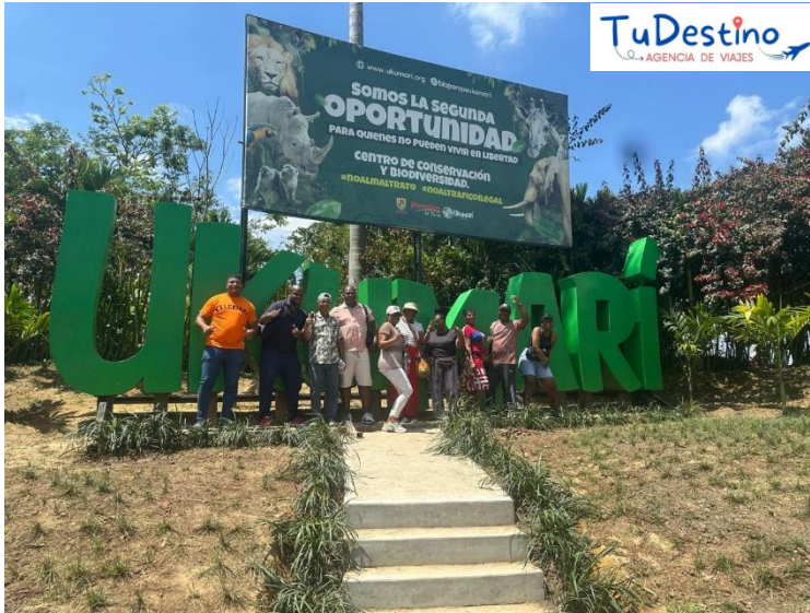
Parque UKUMARI (Pereira)