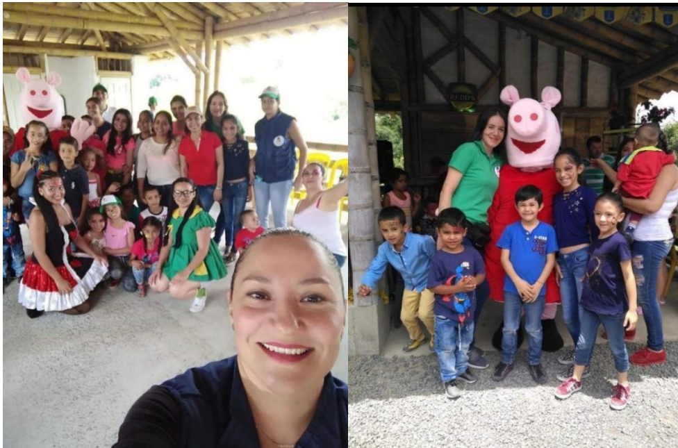
Actividad para niños en compañía de la empresa AUDIFARMA