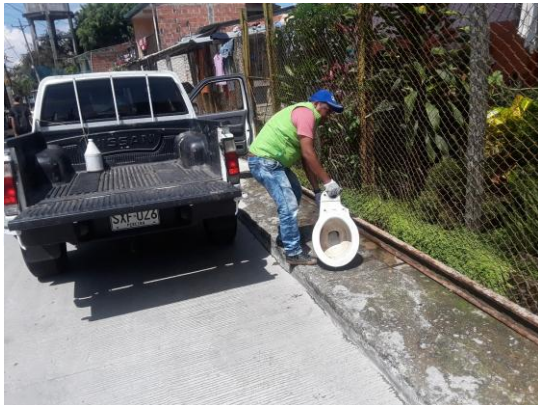
Recolección de enseres inservibles