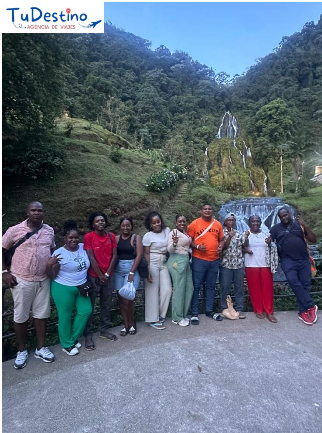
Termales san Vicente (Sta. rosa)