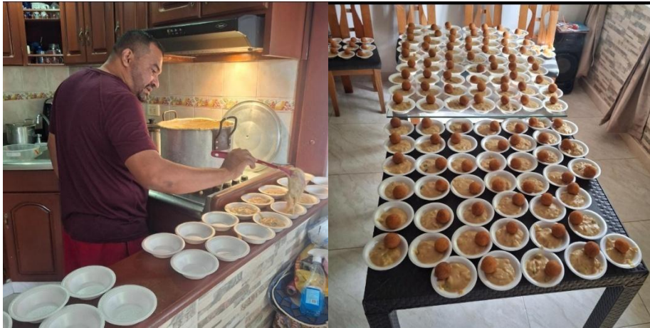
Alistamiento natillas diciembre para personas vulnerables