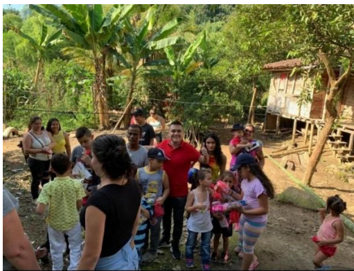
Entrega regalos navidad