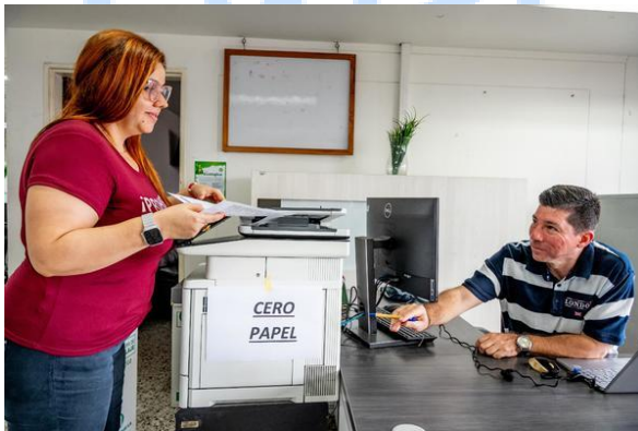
Campaña de CERO PAPEL

Cuando la compañía adopto el modelo de beneficio de interés colectivo (BIC) se realizaron capacitaciones a los empleados sobre el ahorro de energía, agua, desechos y reciclaje del papel, esto con el fin de empezar a implementar los compromisos adquiridos en la dimensión de prácticas ambientales a nivel interno de la compañía, en el 2025 se implemento el programa de cero papel, la cual sugiere el ahorro de impresiones innecesarias y poder utilizar los medios tecnológicos para las confirmaciones tanto para los clientes internos y externos de la compañía, y con esto poder mitigar el uso innecesario de energía y de papelería y ser mas eficientes y eficaces con los recursos.